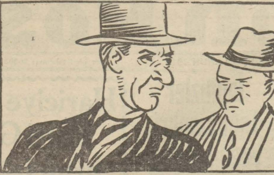
«Hiç kimseyi beğenmeyen adam hiç kimse tarafından beğenilmeyen adamdandır. La Bachefoucauld»